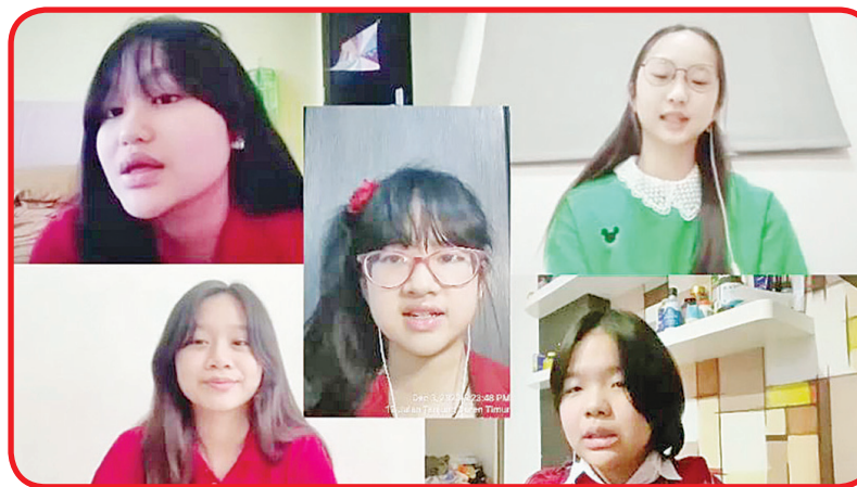
Penampilan vocal group Putri menyanyikan lagu.