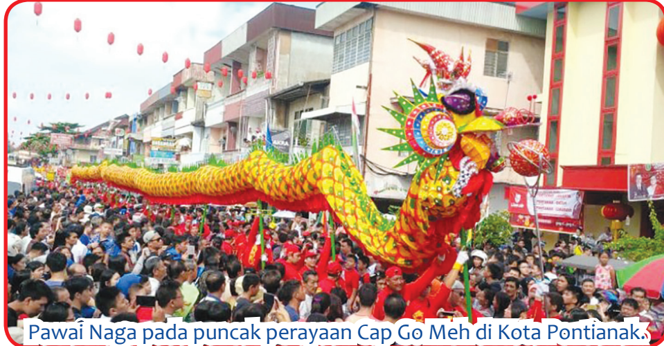
Pawai Naga pada puncak perayaan Cap Go Meh di Kota Pontianak.

erti tatung dan kegiatan arakan naga ditiadakan. Mengingat Provinsi Kalimantan Barat masih dalam suasana pandemi Covid-19. • idn/din