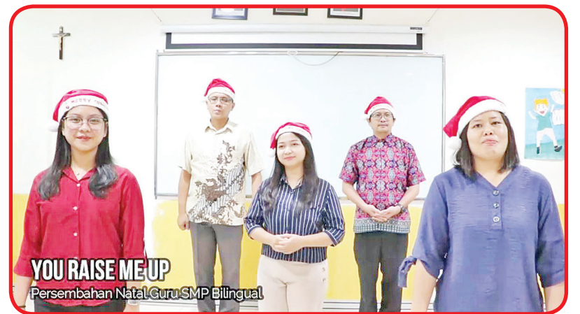
Penampilan vocal group para guru menyanyikan lagu "You Raise Me Up".

JAKARTA (IM) - Sekolah Bunda Mulia Rabu (6/1) lalu menyelenggarakan perayaan Natal 2020 Online.