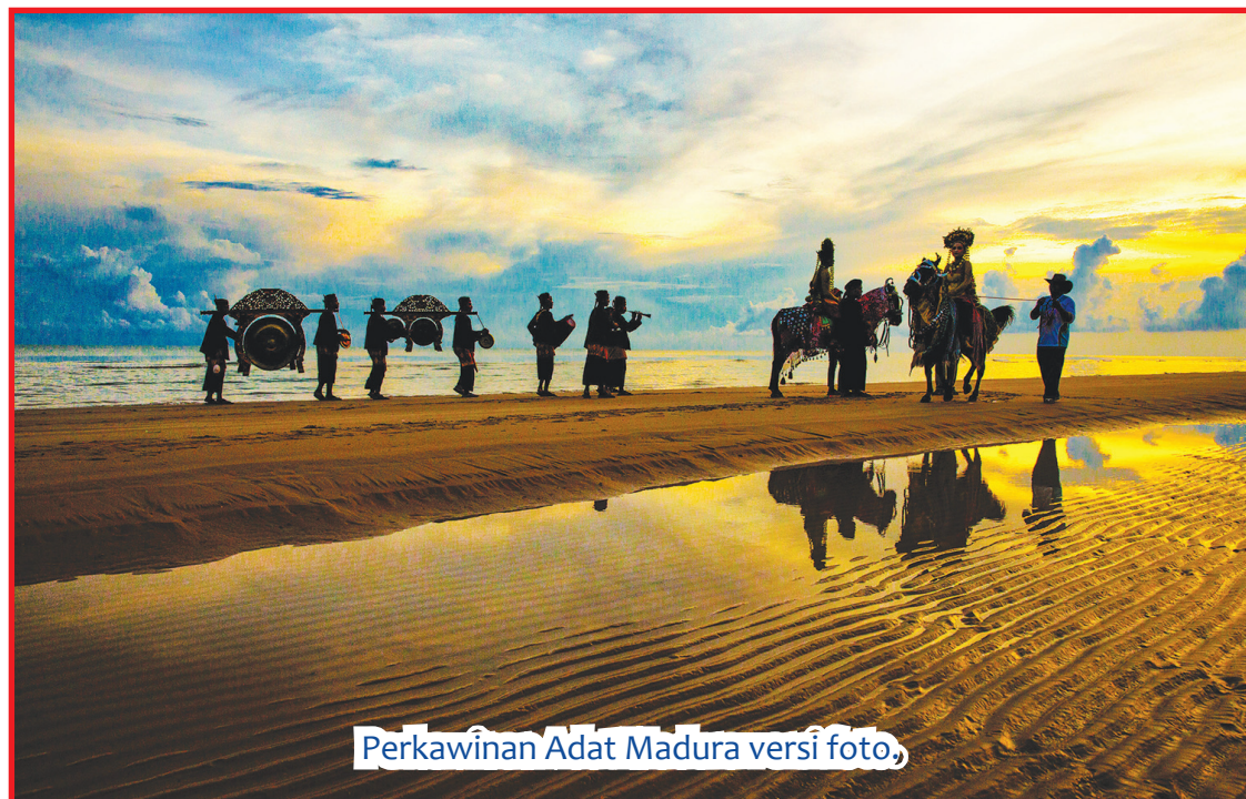
Perkawinan Adat Madura versi foto,