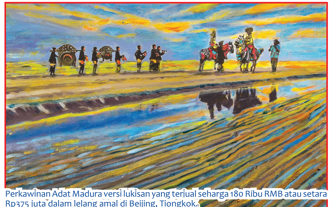
Perkawinan Adat Madura versi lukisan yang terjual seharga 180 Ribu RMB atau setara Rp375 juta dalam lelang amal di Beijing, Tiongkok.