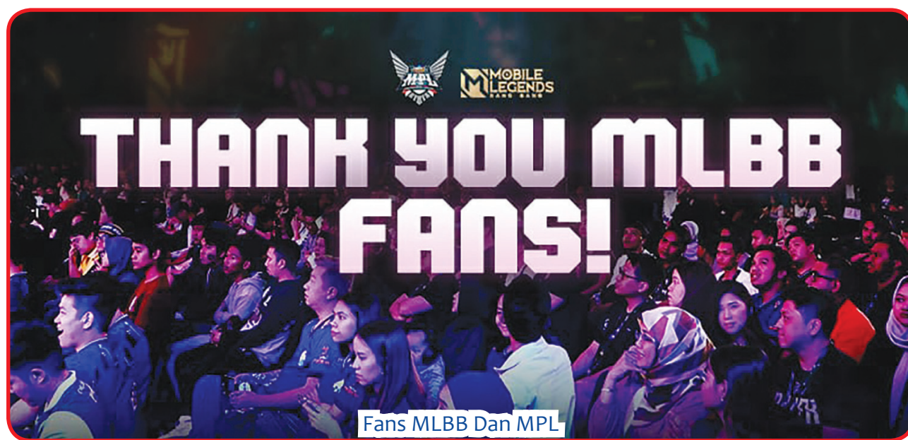
Fans MLBB Dan MPL

masih menjadi yang terdepan di industri esport Asia Tenggara. Selama kurun waktu satu tahun, setidaknya ada 20