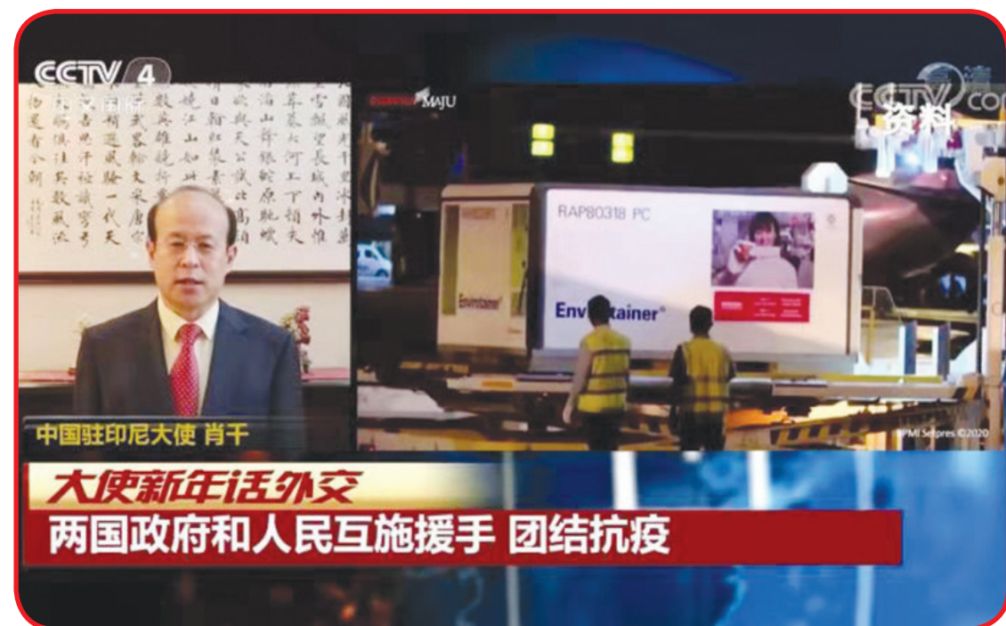
Dubes Xiao Qian saat diwawancarai CCTV.

Dubes Xiao Qian menyatakan 2021 adalah peringatan 100 tahun berdirinya Partai Komunis Tiongkok sekaligus tahun pertama dari "Rencana Lima Tahun ke-14". Tiongkok akan memulai perjalanan baru dalam membangun negara sosialis modern secara menyeluruh dan hubungan Tiongkok-Indonesia berada di titik awal sejarah yang baru. Semua rekan Kedubes Tiongkok di Indonesia akan terus mengikuti konsensus kedua kepala negara untuk mendorong kedua belah pihak menjaga momentum pertukaran tingkat tinggi, memperdalam kerja sama praktis, bekerja sama untuk mengatasi epidemi, mencapai pemulihan ekonomi dan