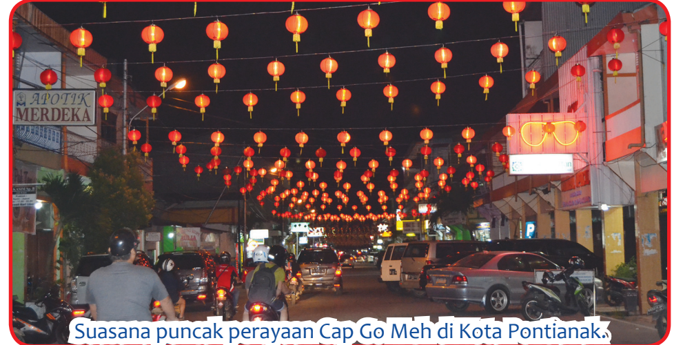
Suasana puncak perayaan Cap Go Meh di Kota Pontianak.